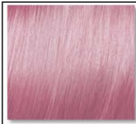
MOODY PINK 915