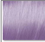
MOODY VIOLET 917