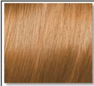
MOODY ORANGE 904