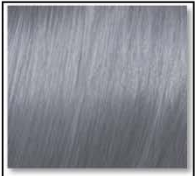
MOODY GREY 912