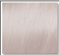
MOODY BEIGE 928