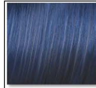
MOODY BLUE 911