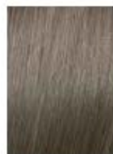
Biondo Chiarissimo Cenere Extra Light Ash Blonde Rubio Clarísimo Ceniza