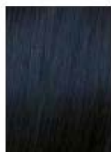
Nero Blu Blue Black Negro Azulado