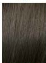
Biondo Scuro Naturale Cenere Dark Natural Ash Blonde Rubio Oscuro Natural Ceniza