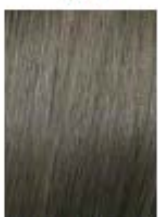
Biondo Naturale Cenere Natural Ash Blonde Rubio Natural Ceniza