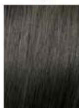
Castano Chiaro Naturale Cenere Light Natural Ash Brown Castaño Claro Natural Ceniza