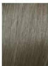
Biondo Chiaro Naturale Cenere Light Natural Ash Blonde Rubio Claro Natural Ceniza