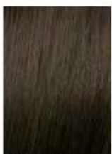
Biondo Scuro Cenere Dark Ash Blonde Rubio Oscuro Ceniza