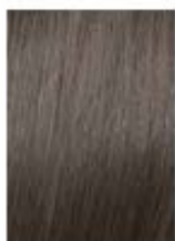
Biondo Chiaro Cenere Light Ash Blonde Rubio Claro Ceniza