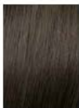
Biondo Cenere Ash Blonde Rubio Ceniza