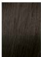
Castano Chiaro Cenere Light Ash Brown Castaño Claro Ceniza